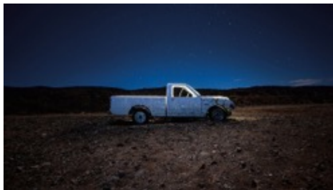
Pick-up #1 , Jean-François Bouchard, 2019. Édition de 3, Impression chromogène. 42po x 84po.