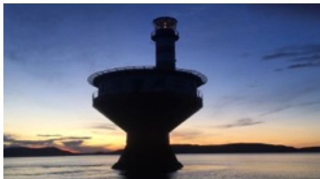
Le Rêve , Mat Chivers, 2018, Installation vidéo monobande en boucle, 11 min.