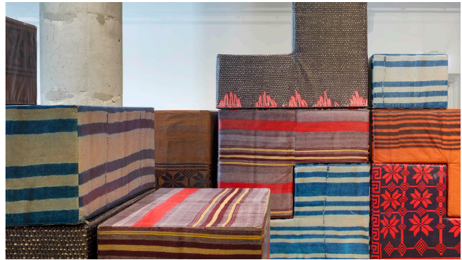
DEMOS : A Reconstruction , Andreas Angelidakis, 2019, Modules de mousse et de vinyle, dimensions variables.